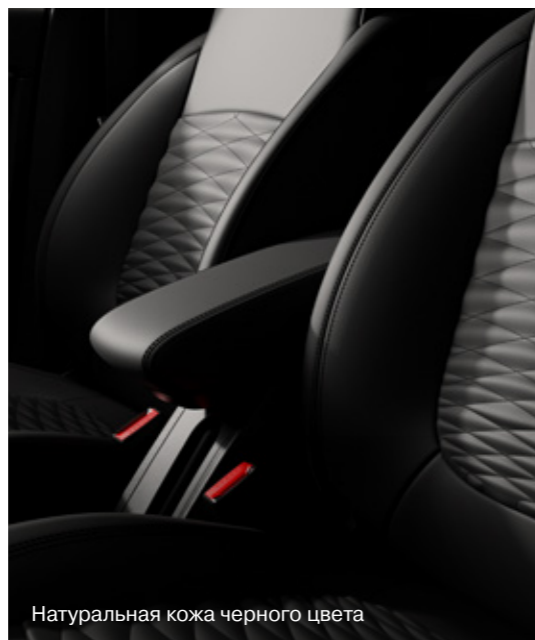
Натуральная кожа черного цвета