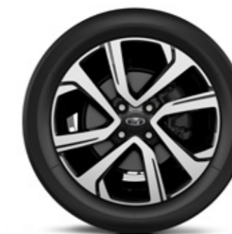
R16 двухцветные легкосплавные диски