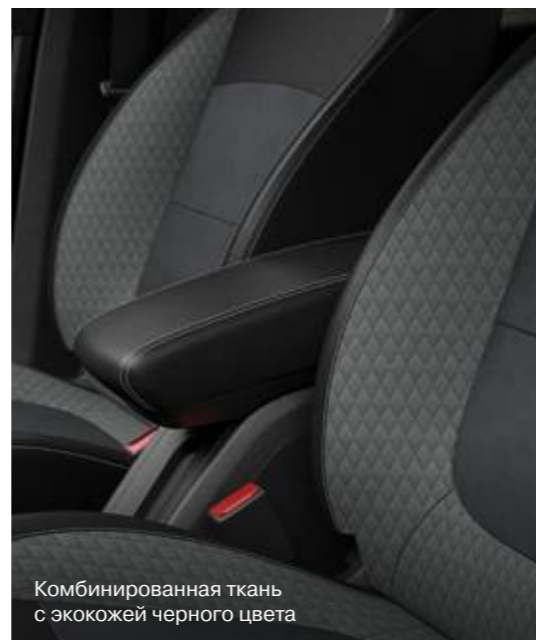
Комбинированная ткань с экокожей черного цвета