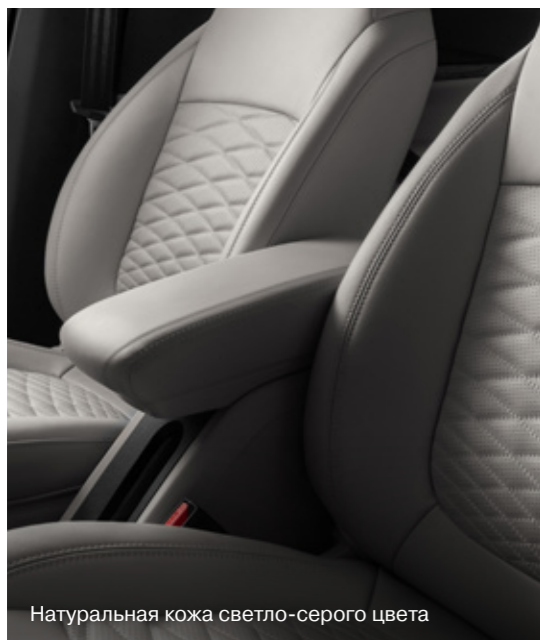
Натуральная кожа светло-серого цвета