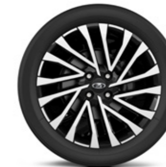
R17 двухцветные легкосплавные диски